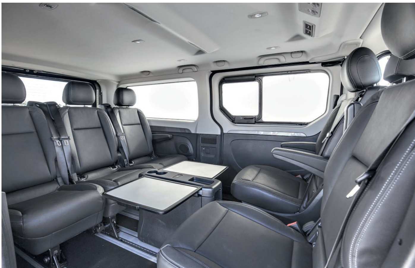
Mit dem «Pack Signature» verwandelt sich der Trafic SpaceClass in eine «mobile Lounge»